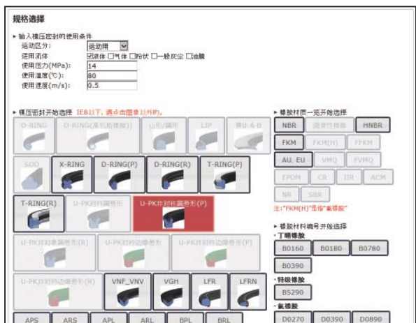
Figure3 使用①形状进行搜索时的输入