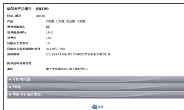
Figure5 使用③材料进行搜索时的输入