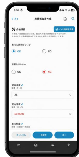
第4図 ZeroVisit のサービス (PC・スマートフォンのイメージ)

MONiPLAT、ZeroVisit は株式会社バルカーの商標または登録商標です。