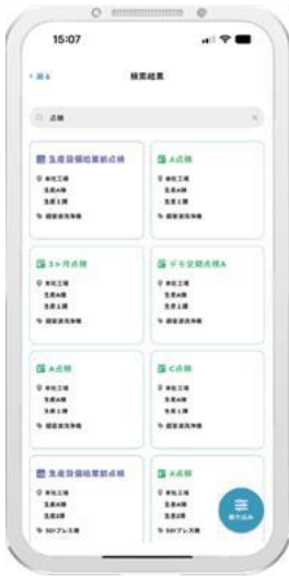
第2図 MONiPLAT のサービス (スマートフォンイメージ)