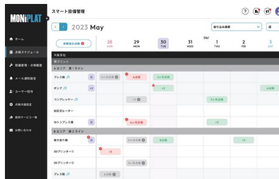
第3図 MONiPLAT ™ のサービス (PC イメージ)